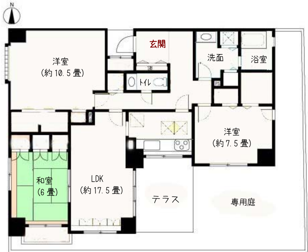
※間取図面・寸法は実際と異なる場合がございます。